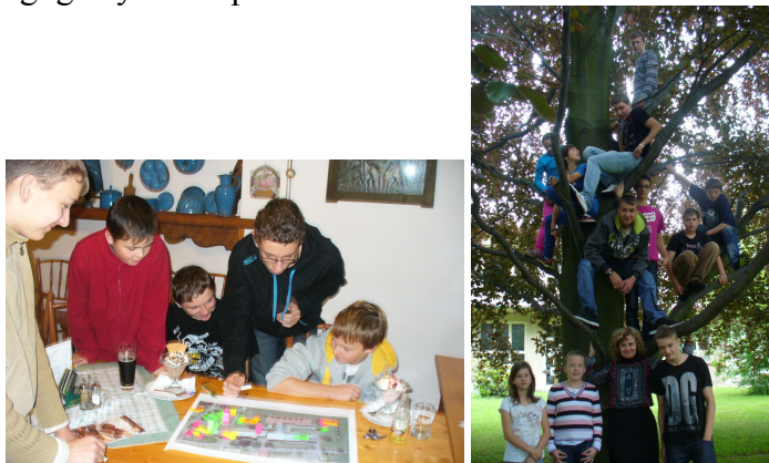
Žákovský parlament 2012/2013.

Žáci mohou vyjádřit svůj názor na dění ve škole v žákovském parlamentu, který tvoří volení zástupci 4. - 9. tříd. V letošním školním roce se uskutečnilo také výjezdní zasedání parlamentu a byla rozšířena spolupráce se zřizovatelem. Zástupci žáků zmapovali světlá a tmavá místa školy a později také našeho města. Vznikla mapa s barevně označenými místy, zelená znamenala místa, kde se děti cítí dobře, růžová – zde se cítíme nepříjemně, žlutá – tady by se dalo něco zlepšit, oranžová – zde cítíme nebezpečí. Výsledek byl zajímavý pro pedagogický sbor i pro zřizovatele.