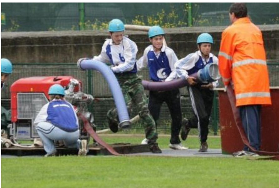
1. Místo v královské disciplíně- požární útok (na nástřikové terče)