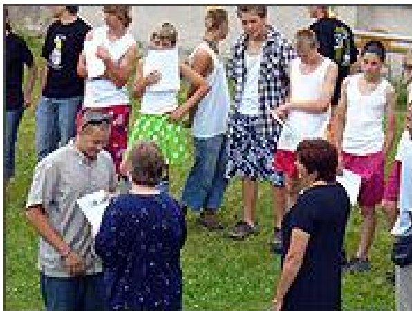
Krásná závěrečná píseň na rozloučenou