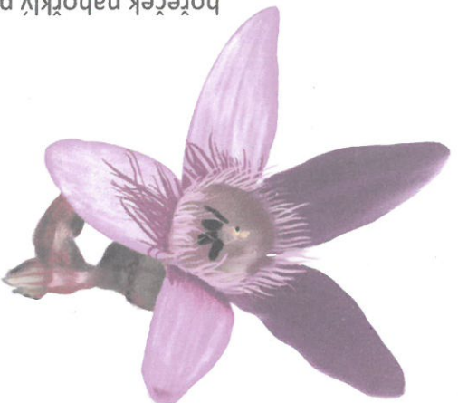
hořeček nahorklý pravý