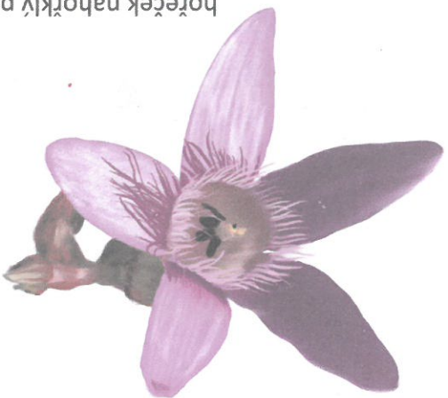
hořeček nahorklý pravý