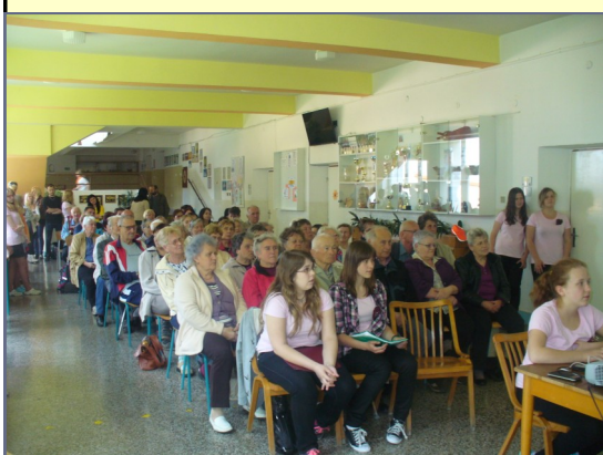
žáci hudební dílny